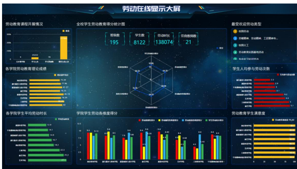
图 5 劳动在线显示大屏

充分发挥学校的信息技术优势，创建实践啦·劳动在线特色应用项目，获评高校智慧思政特色应用场景建设单位。该项目以弘扬劳动精神为主旨，提升学生劳动素养为核心，按照劳动教育“目标可导入”“项目可发布”“过程可追溯”“效果可评价”“学生可成长”“流程可改进”的底层逻辑开展建设，实现劳动教育的数字化和智能化。