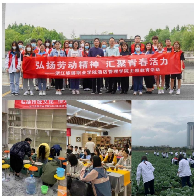
图 3 “美丽校园”劳动实践活动

学校将每周三作为“美丽校园创建日”，五月作为“劳动文化月”，各专业根据实习实训安排设定“劳动周”，养成良好的劳动习惯；连续 5 年，组织由退伍学生组成的教官大队参与新生军事训练，共训练学生 25000 余人次。开展劳动精神、劳模精神、工匠精神专题讲座百余场，举办具有专业特色的“一院一品”校园劳动文化活动。