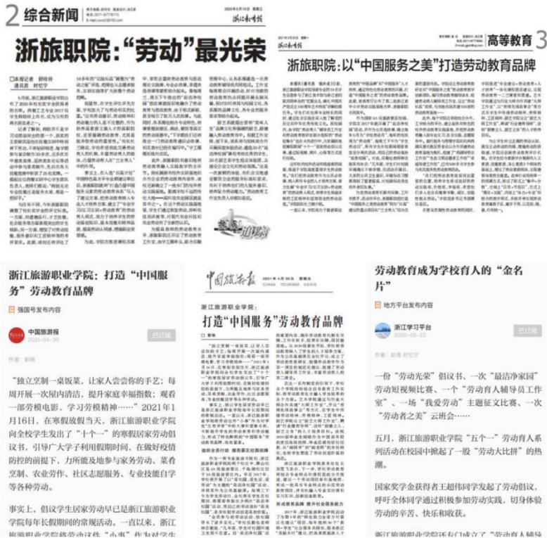
图 7 学习强国 App、中国旅游报、浙江教育报关注报道学校劳动育人工作

学校开展立足办学特色和人才培养定位的“中国服务”劳动教育，受到了学生家长、其他高校、社会各界的高度关注和肯定。多年来，劳动育人工作成效被人民网、光明网、中国教育报、中国旅游报、浙江日报等主流媒体报道，关注量超 20 万人次。