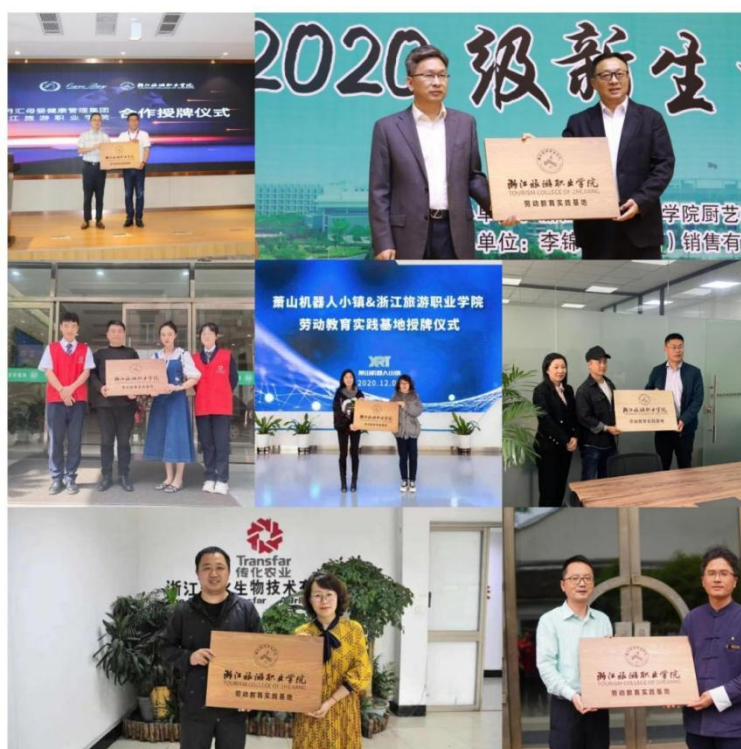
图 2 部分劳育实践基地挂牌