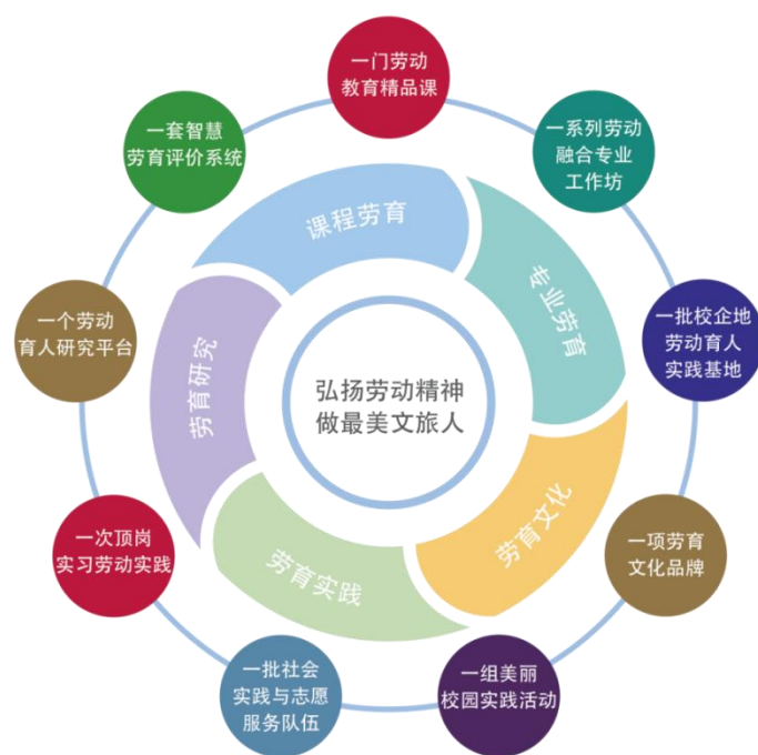
图 1 “519”劳动育人模式

劳动教育是学校育人工作的“金名片”，体系构建探索开始于2009年，走在高校前列。学校是全国首届高职院校“育人成效50强”单位，获评浙江省“三全育人”综合改革重点支持高校，是浙江省中小学劳动实践基地。“519”劳动育人模式获浙江省高校思想政治工作精品项目立项，入选浙江省高校“实践育人”优秀工作案例。在长期的劳动育人实践中，学校形成了“519”劳动育人模式，这也与“519”中国旅游日不谋而合，开拓创新、行者无疆的“霞客精神”更为文旅人的劳动教育注入灵魂。