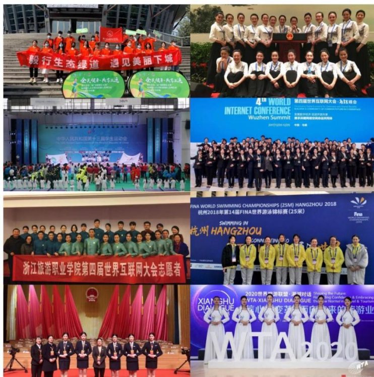
图 4 组织学生参与大型活动志愿服务

组织学生参与 G20 峰会、世界游泳锦标赛、亚运会、世界互联网大会等大型活动的志愿服务工作，受到组织方广泛好评；组织暑期社会实践学生队伍助力乡村振兴，参与“万村景区化”“微改造，精提升”等浙江省重大文旅工程，在社会服务中，培育学生奉献社会的劳动服务意识。